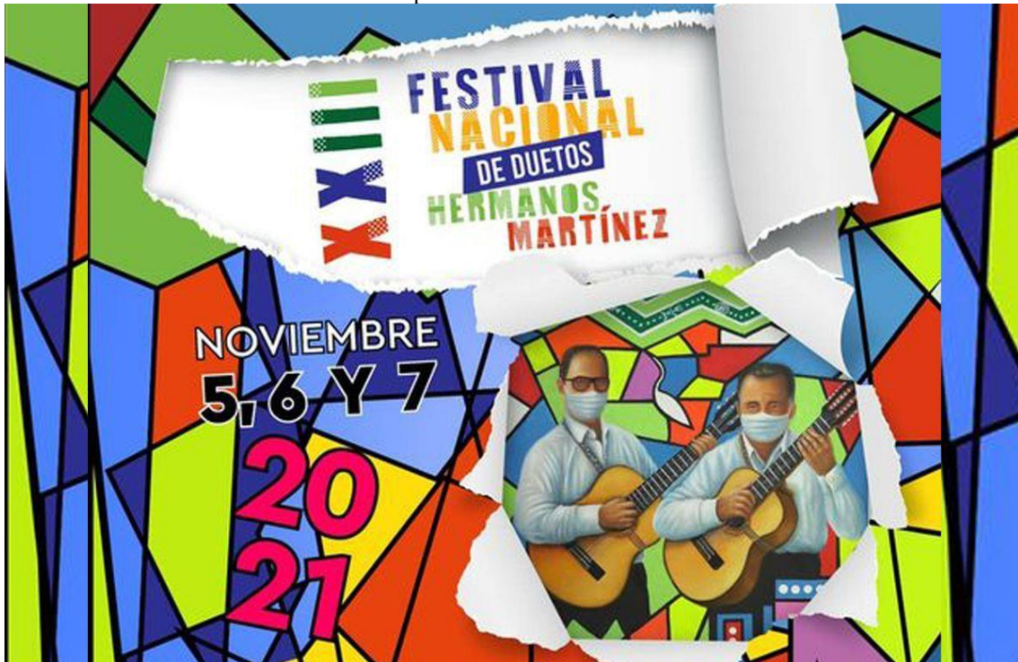
Afiche promocional Concurso 2021

En conclusión, el Concurso Nacional de Duetos Ciudad Floridablanca-Hermanos Martínez es un evento trascendental en la historia musical de Colombia y un bastión de nuestra identidad cultural. Su declaración como patrimonio cultural sería un paso crucial para salvaguardar y promover nuestra música folclórica, así como para preservar y transmitir a las futuras generaciones la riqueza y diversidad de nuestra herencia musical.